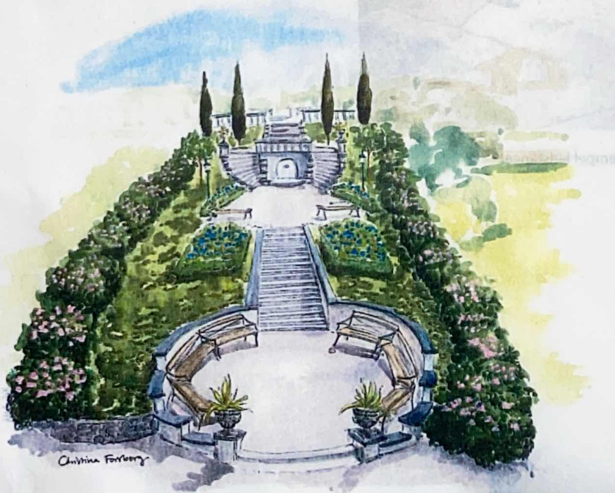
Bild 1. Visionsbild utformning. Ej skalenlig och framtagen i tidigt skede, varför vissa detaljer kommer förändras under processen p g a utrymmesbrist eller genomförbarhet.