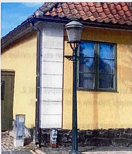
Bild 2. Exempel belysning